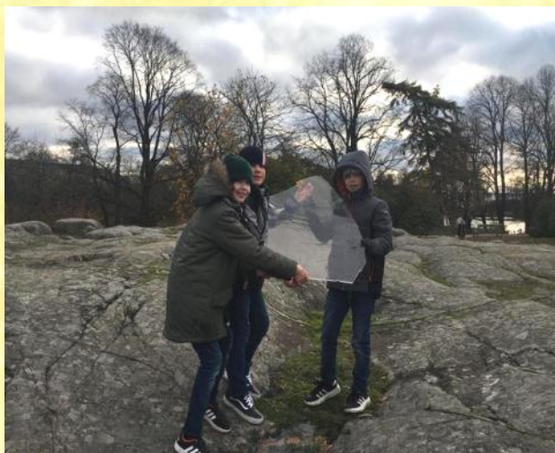
Учащиеся 4-го класса

же, построить новый, теперь уже снежный город! Надеемся, что обитателям парка, наблюдающим за нами из своих гнёзд и норок, он понравится. Добро пожаловать в гости!